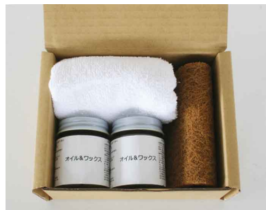
31091 オイルメンテナンスキット FC ¥6,400(税別)

※メンテナンスキットは製品に合わせ3種ご用意しています。製品に合ったオイルをご使用下さい。 (OEM製品の適用につきましては別途お問い合わせ下さい。)