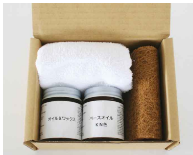
31092 オイルメンテナンスキット KN ¥6,400(税別)