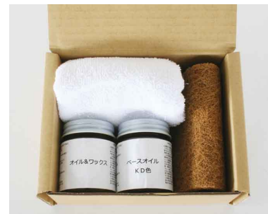
31093 オイルメンテナンスキット KD ¥6,400(税別)